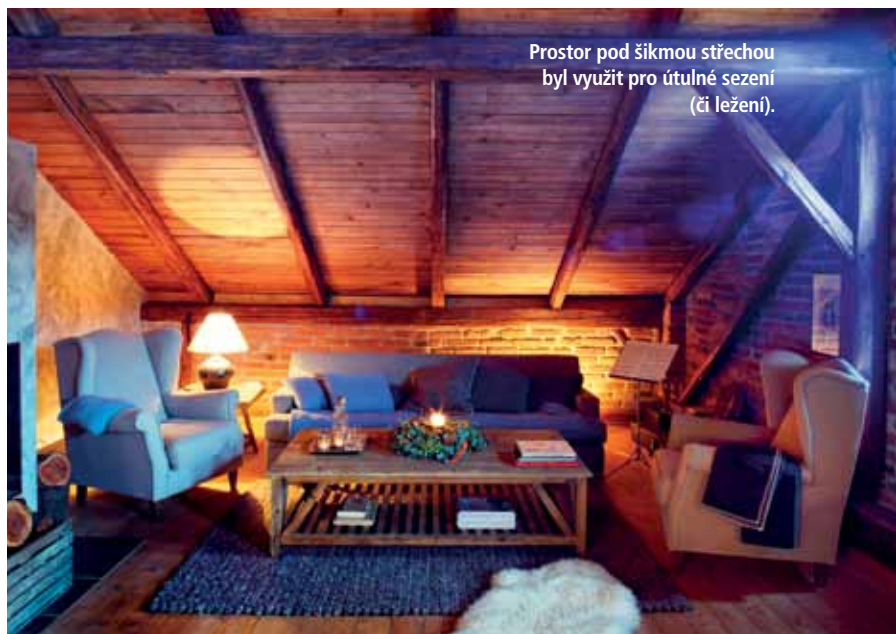
Prostor pod šikmou střeou byl využit pro útulné sezení (či ležení).